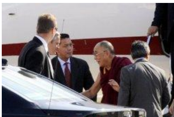
dalajlama po prílete na Slovensko